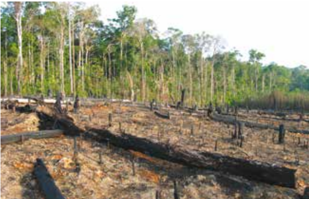
En Amazonie, pour créer de nouvelles surfaces agricoles, de vastes étendues de forêts sont coupées et brûlées.

La déforestation est source d'émission de gaz à effet de serre car les sols relâchent une partie du carbone organique stocké. En supprimant des végétaux qui auraient absorbé le \text{CO}_2 , elle participe également à l'augmentation de la concentration de ces gaz dans l'atmosphère.