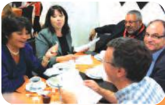
1 ère réunion de bureau dans la bonne humeur