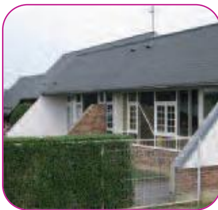
Ecole en site urbain

D'ici la mise en œuvre de cette proposition, le deuxième Plan National Santé Environnement (PNSE) 2009-2013 a proposé une campagne pilote de surveillance de la qualité de l'air intérieur dans les lieux clos ouverts au public, en commençant par les écoles et les crèches (voir "Quel air est-il?" n°71).