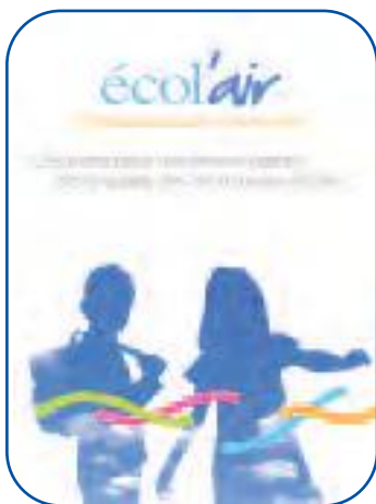
Pochette écol'air et ses outils