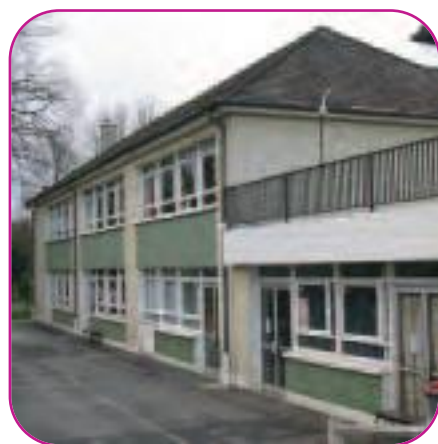
Ecole en milieu industriel