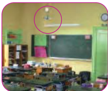
Dispositif de mesure installé en classe

Dans chaque établissement, entre une et huit pièces étaient étudiées (salles de classe ou pièces de vie). Une mesure complémentaire de benzène était réalisée à l'extérieur du bâtiment.