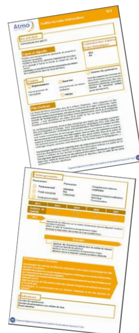
L'une des 18 fiches actions du PRSQA Hauts-de-France