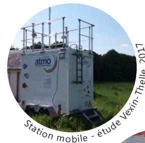
Station mobile - étude Vexin-Thelle, 2017