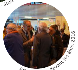
Intervention devant les élus, 2016